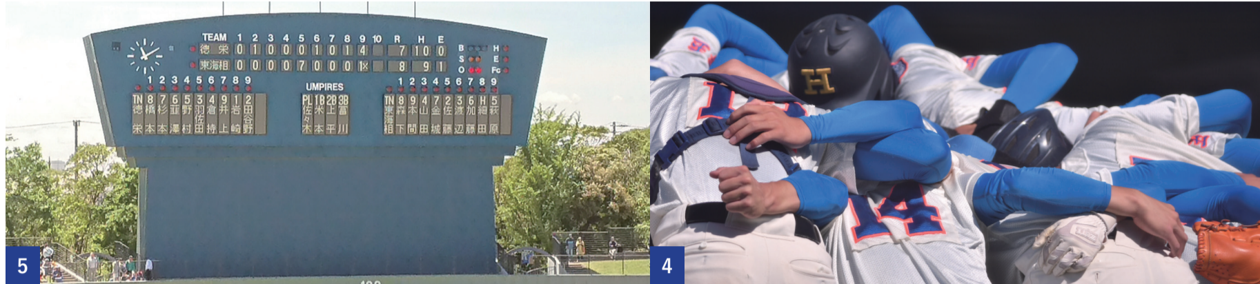
1 2 3 躍動する徳栄の選手たち。連日、驚異的な粘りで大きなビハインドを追いつく 4 春のセンバツ甲子園ベスト4の強豪・東海大相模へ全力でぶつかった 5 屈指の強豪対決は熾烈な勝負となり、最後はサヨナラホームランでの幕切れとなった