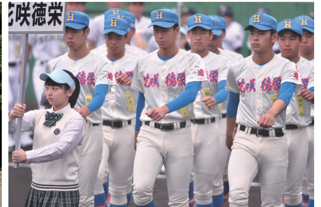
第70回春季関東大会へ埼玉県代表として出場した花咲徳栄ナイン