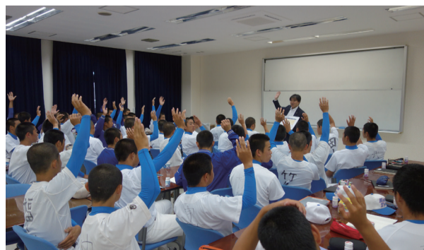
今春、入学した新入部員（1年生：総勢52名）への湖池屋による「口腔ケア勉強会」の様子。口腔内ケアに関する多くの質問があり、1年生ながら予防に対する強い自覚と向上心を感じた

高校野球、そして夏の甲子園。今年は100回記念大会という節目でもあり、俄然注目を集めている。昨年の99回大会は全国の3839校が地方大会での予選に参加し、16万人以上といわれる高校生球児が切磋琢磨し、頂点を目指した。昨年、その頂点に立ったのが花咲徳栄高校（埼玉県勢・初優勝）であった。地方大会から甲子園の決勝まで、灼熱の7・8月に1度も負けることなく、全国制覇するのは至難の業であり、数々の強豪チームがそれに挑戦しながら「あと1歩の壁」に跳ね返されている（参加校が多い都道府県は12〜13連勝が必要となる）。