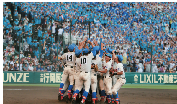
昨年、埼玉県勢で初の選手権制覇を成し遂げた花咲徳栄ナイン