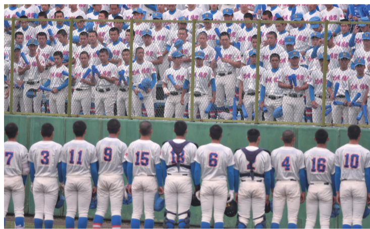
惜しくも2回戦で東海大相模にサヨナラで敗退した徳栄ナイン。本番の夏での勝利を皆で誓った